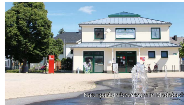
Naturpark-Infozentrum in Medebach

An den „Eingängen“ zum Naturpark Sauerland Rothaargebirge wird es sechs Infozentren geben. In Bad Berleburg, Burbach, Hemer, Lennestadt/Kirchhundem, Medebach und Meinerzhagen kannst du dich über Ausflugs- und Freizeitmöglichkeiten im Naturpark sowie die Arbeit des Trägervereins informieren. Mit nur einem Klick entdeckst du an interaktiven Tischen die vielen Naturpark-Juwelen wie Burgen und Schlösser, Höhlen und Klippen, Industriedenkmale und Schutzgebiete. Allesamt bezaubernde Orte, die einen Besuch lohnen.